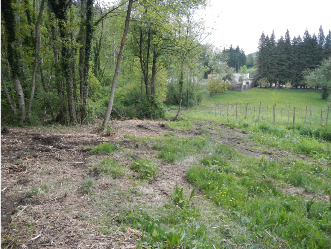
Formazioni primarie a ridosso di aree coltivate.