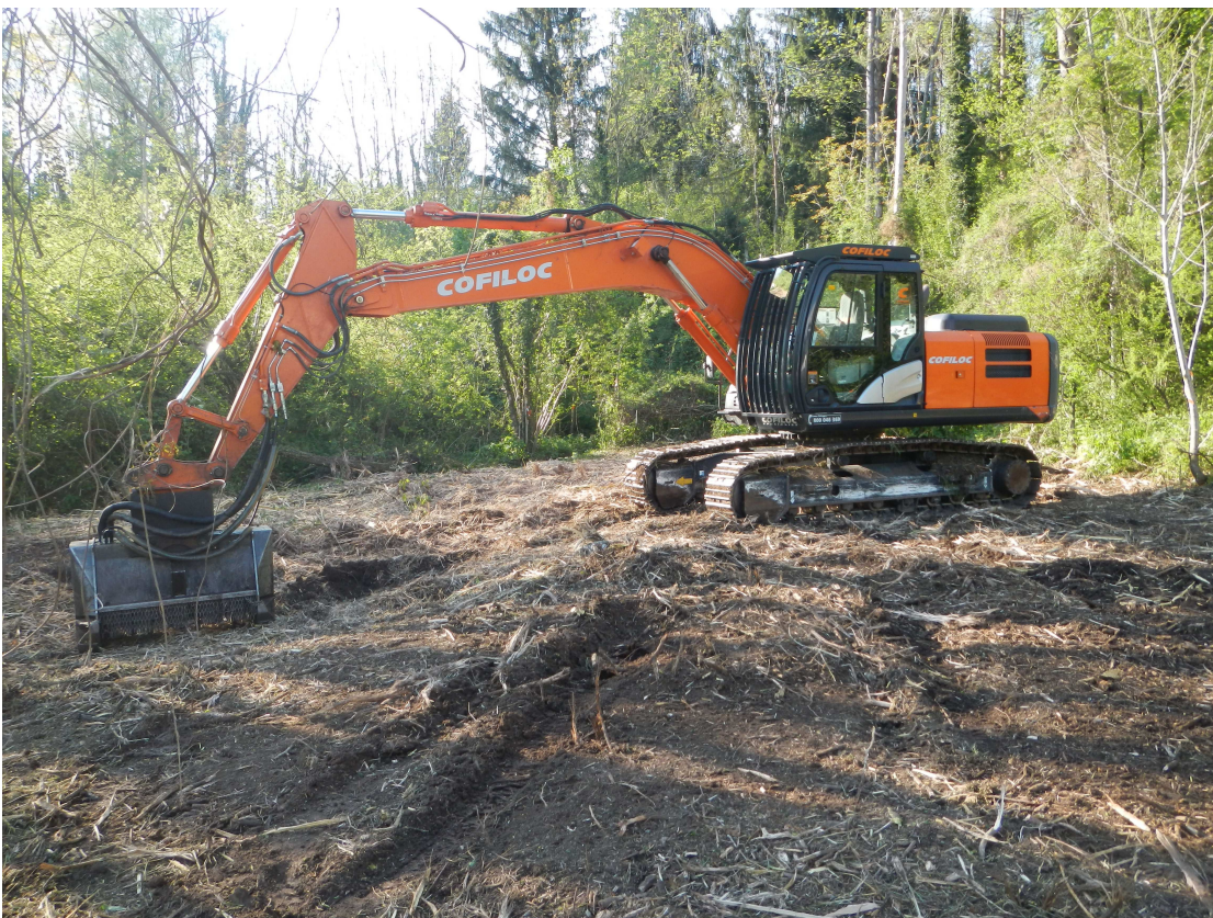
Particolare intervento con escavatore e fresa.