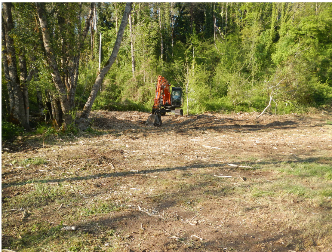
Lavorazioni in corso presso la zona cimiteriale di Verzegnis.