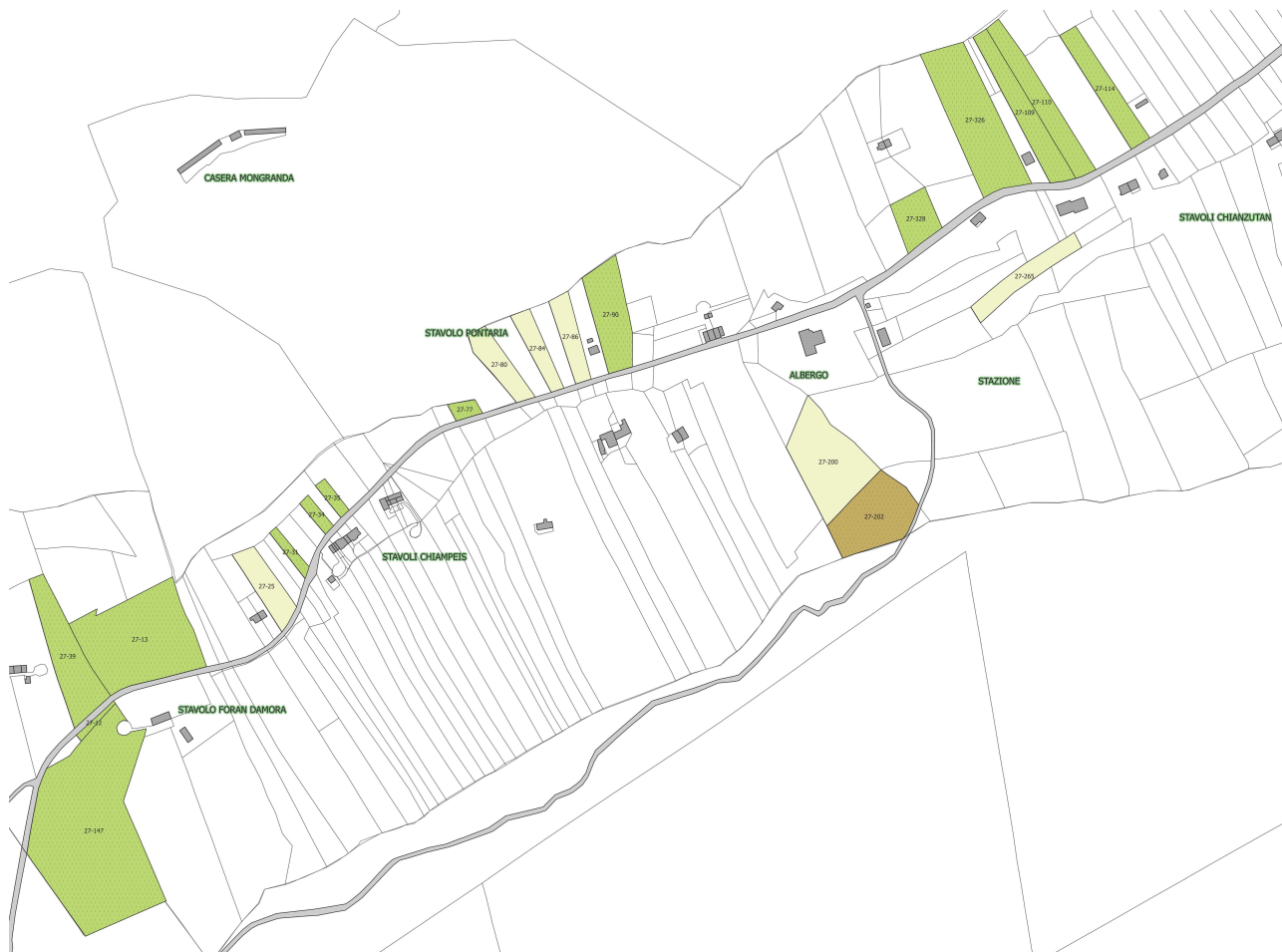
Carta di dettaglio su base catastale (scala 1:2.000) aree da recuperare.

TITOLO: Progetto definitivo-esecutivo interventi di risanamento e recupero di terreni incolti e/o abbandonati in Comune di Verzegnis (UD)